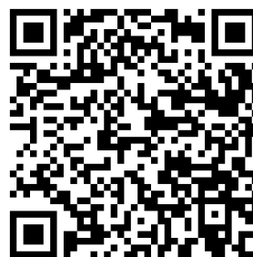
ユネスコ無形文化遺産「風流踊」パンフレット