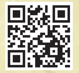
↑ 風流踊ホームページ